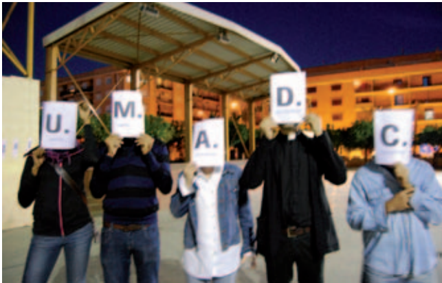
Acción UMADC: Unidad móvil por el disfrute colectivo. 2010.