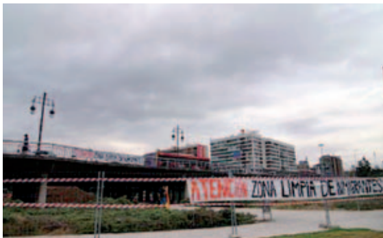
Acción ciudadana contra el desalojo de los inmigrantes en el puente de Ademúz.