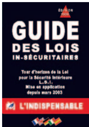
Proyecto Guide des Lois In-Sécuritaires . París 2007.