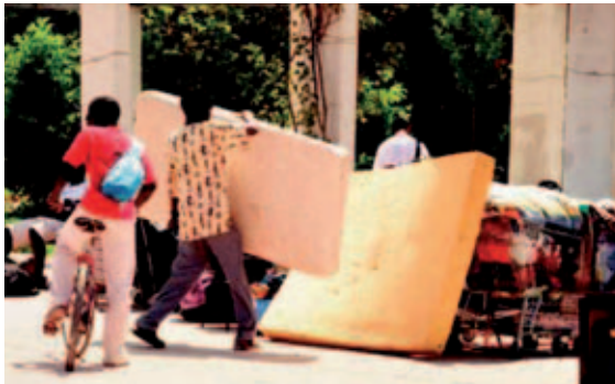
Desalojo de inmigrantes bajo el puente de Ademúz.