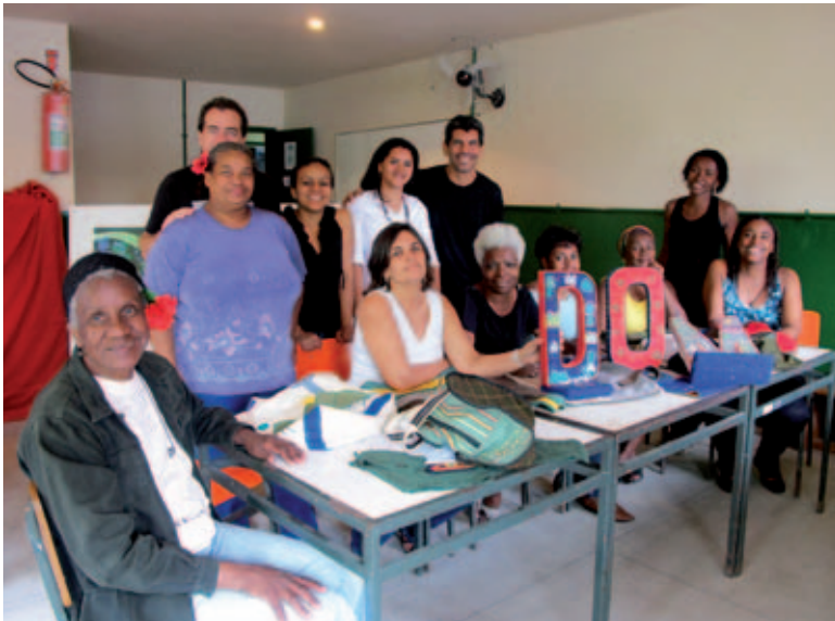
Componentes de la cooperativa.

Brasil. Son una cooperativa de costura creada por mujeres de la Comunidad de Cidade de Deus, en Rio de Janeiro. Esta cooperativa se constituyó como respuesta a la falta de oportunidad y de espacio en el mercado laboral. A la vez, la cooperativa es una forma de reflejar a través de la creatividad sus ideas, identidades, saberes, vivencias y experiencias. Usan la costura como herramienta de trabajo, parten de su precariedad y la convierten en un horizonte de posibilidad, reciclando residuos y materiales para confeccionar ropas y artefactos. Su lucha es el propio cotidiano y a través del fortalecimiento de lazos, buscan crear una nueva realidad, pero siempre partiendo desde su idea de pertenencia y volcando sus actividades en la comunidad en la que viven. La cooperativa parte de la escasez para la producción pero sin renunciar a la acción y consigue alcanzar nuevas posibilidades gracias a la responsabilidad social que representa el autosostenimiento.