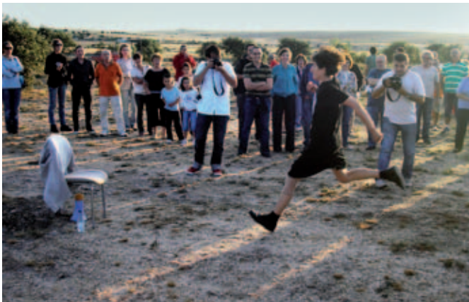
Performance a varias velocidades.