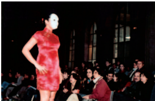
Participante en el desfile: Colectivo France Prostitution.