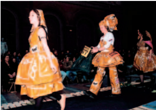
Participantes en el desfile: trabajadoras de la FNAC.