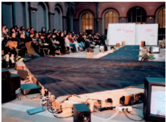
Proyecto Prêt-à-Précaire en París.