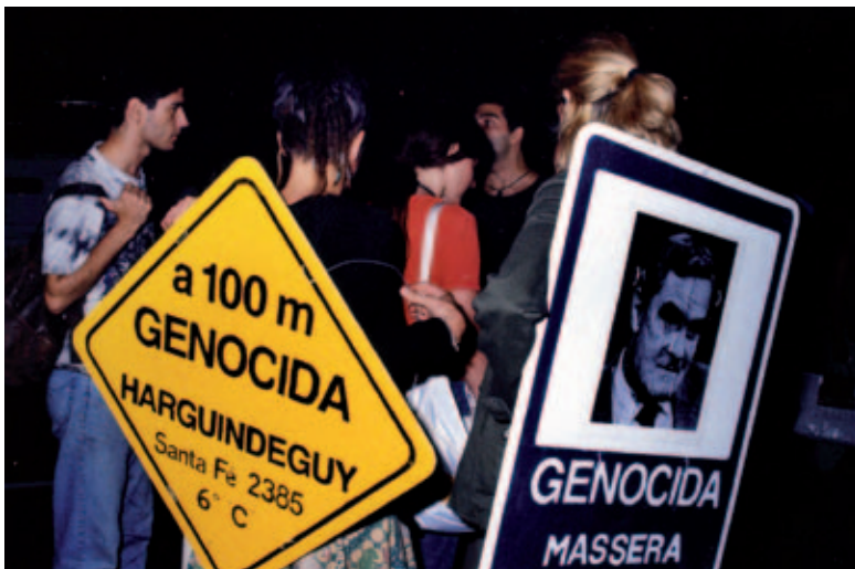
Aquí viven genocidas.